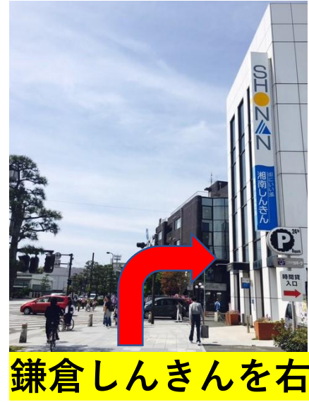
鎌倉しんきん を右