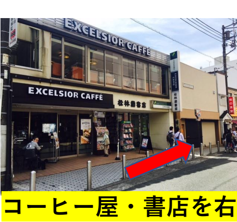
コーヒー屋・書店を右