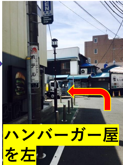
ハンバーガー屋 を左